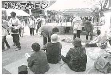
鎌の宮サロン 〔倶利伽藍不動参り〕 今年は例年になく寒く、倶利伽藍の八重桜は2分咲きでしたが、厄除けの赤餅をいただきました。

各地域で行われているサロンを紹介いたします。対象は65歳以上、体操やレクリエーション、手芸、バス遠足などを実施しています。地区のお世話役の方にお申し込み下さい。