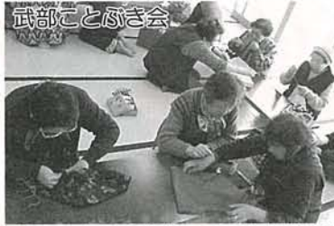
武部ことぶき会 〔ふろしきバッグ作り〕 ふろしきが便利でおしゃれなマイバッグになりました。

折紙、カラオケと和やかに家庭的な雰囲気を楽しんでいます。参加自由ですので皆さん一度顔を出してみませんか。