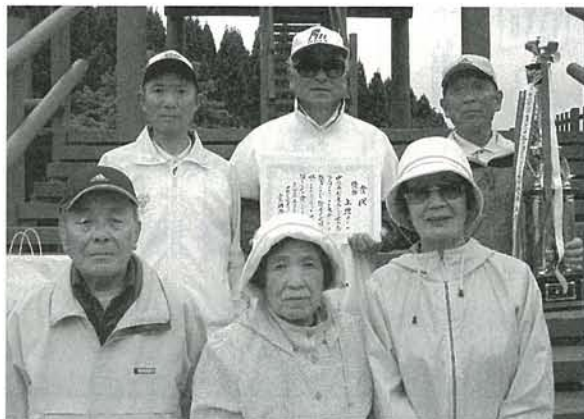
団体の部優勝 上徳Aチーム