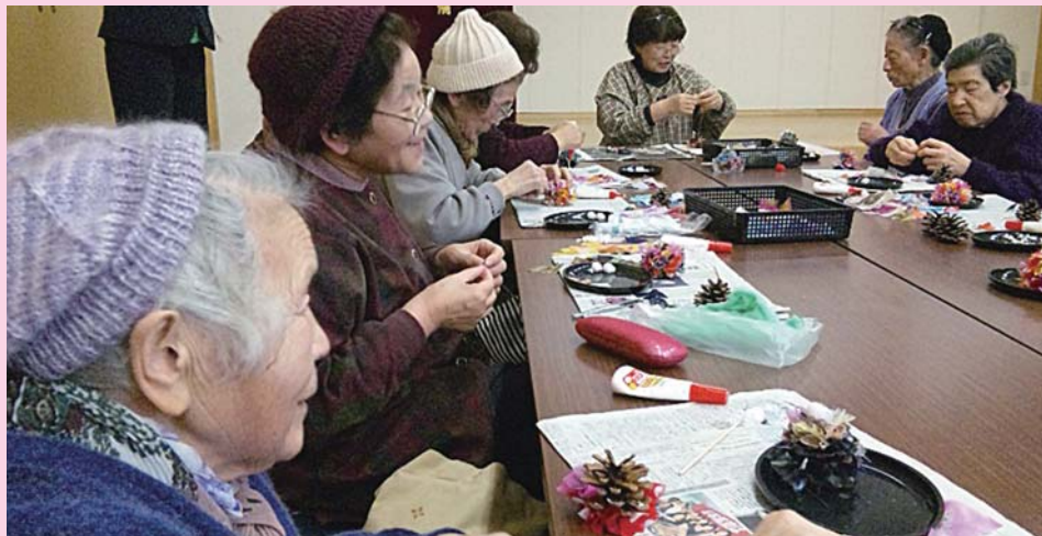
(写真) 瀬戸地区「まつぼっくりでひな人形」 素朴でかわいいおひな様が完成しました