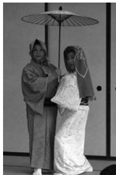
歌謡舞踊 三条流様