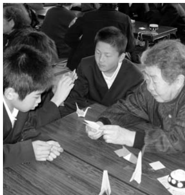
鳥屋小学校6年生の皆さん