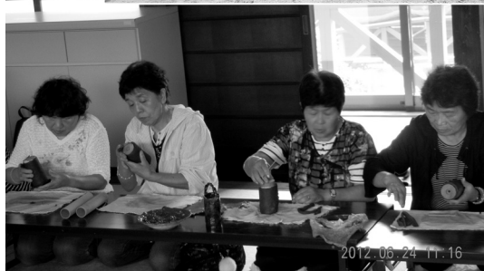
素敵なお花を一輪挿しでお庭のお花を飾る予定です。