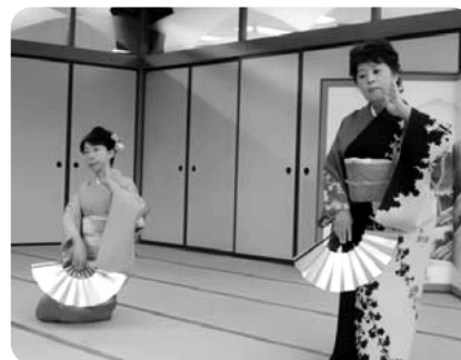
泉流日本舞踊鹿島教室様 あでやかな踊りを披露