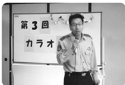
春山駐在所長様 防犯についてのお話も