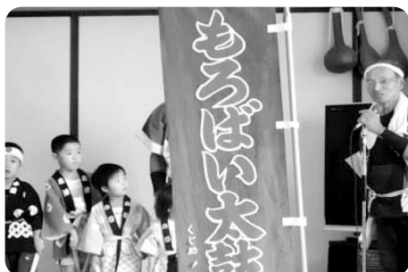
とりやもろばい太鼓様 ちびっこもがんばりました