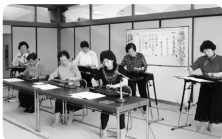
鹿島大正琴すずらんグループ様 ステキな音色