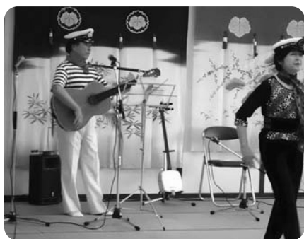
にっこ一一座様 歌・踊り・民謡と 盛りだくさんのステージ