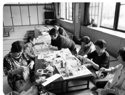
にっこにご組様の指導で 七夕飾り作成