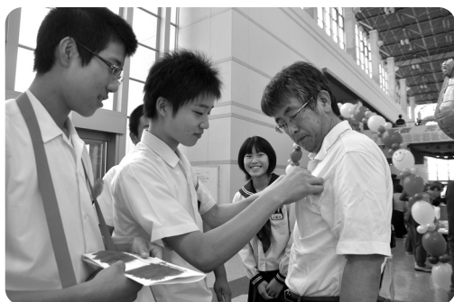
「福祉のつどい」で募金ボランティアの 鹿島中学校生徒会の皆さん