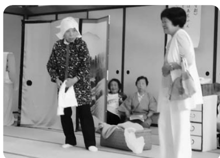
老人保健ビジター様 熟演でした