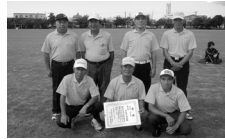
3位に入賞した鳥屋チーム