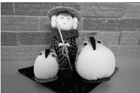
お地藏様とふくろう (手芸愛好者)