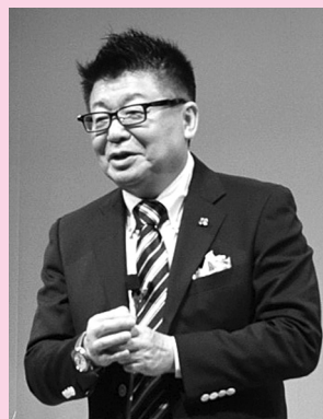
講師 生島ヒロシ氏 演題 「いつまでも 若く生きる秘訣」

普段の小さな積み重ねが健康の基本であると、実践している指の運動や足腰のマッサージ、道具などを紹介しながら、観客と一体になった笑顔あふれる講演会になりました。