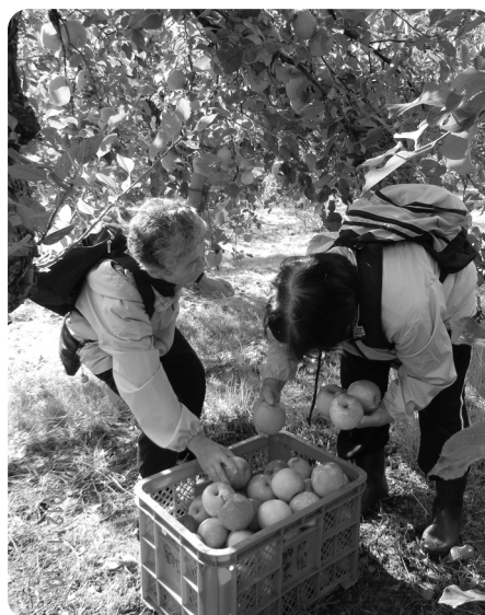
かごいっぱいのりんごを収穫しました。

りんご狩りの後は、ひよっこ温泉で昼食をいただいて、温泉に浸かり一休み。秋のバス遠足は和やかに楽しい一日でした。