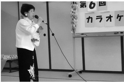
日ごろの練習の成果を発表しました。