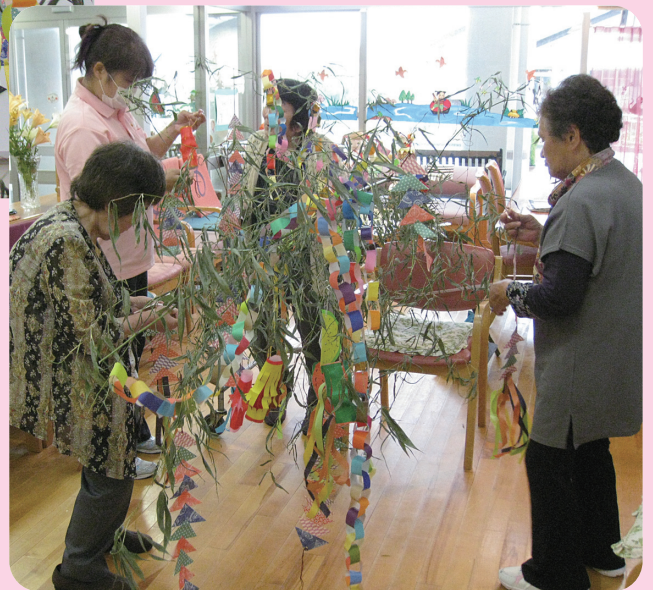
デイサービスセンターひまわり 七夕風景