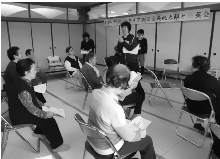
いきいき百歳体操をはじめました。 筋力とバランス能力を高める運動です。 毎週月曜日10時40分から