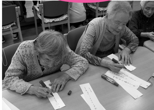
願いを一つ、感謝を一つ 短冊に。