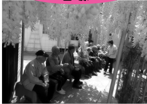
この藤、幹が一本や。 はあ〜、見事なもんや。