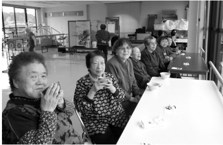
お抹茶をいただきながらのお花見です。