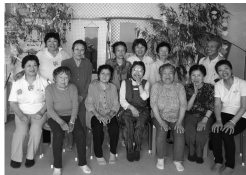
につこにこぐみ様による交通安全教室 恒例の七夕飾りも作りました。