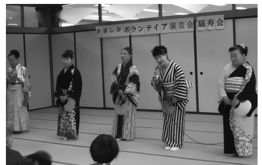
歌謡舞踊やハーモニカにあわせて 合唱をした扇寿会様