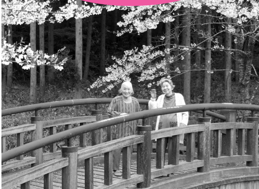
今年のさくらもきれいやね。 —永光寺にて—