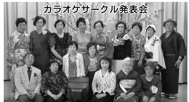
サークルの皆さんが一年の練習成果を発表されました。