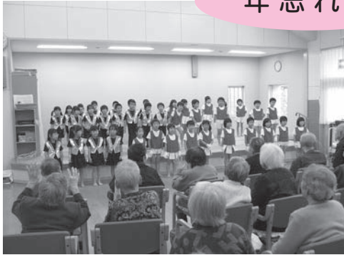
さくら保育園 めろん組の皆様