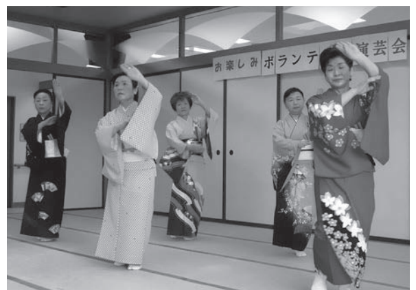
息の揃った踊りを披露 華翔会様