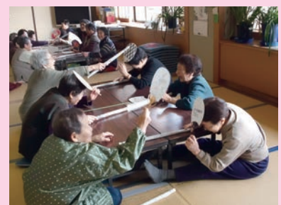
脳トレゲームで大盛り上がり！