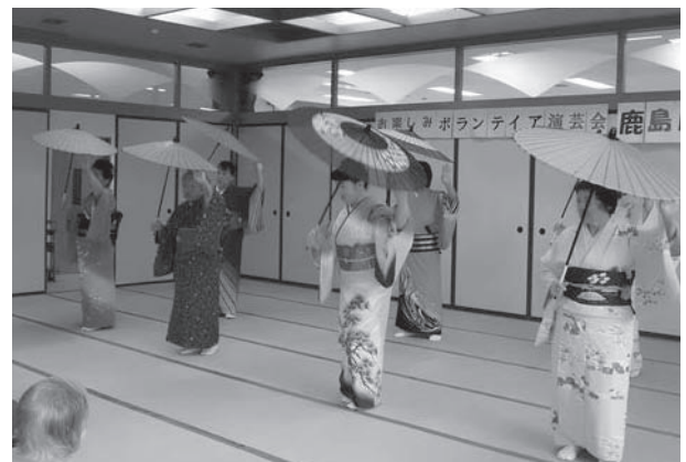
ステキな踊りを披露していただきました 鹿島日舞会様