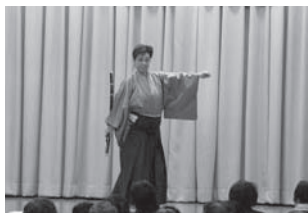
英桃太郎・鈴英会様