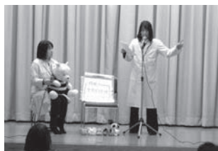
なかのとまち薬局様