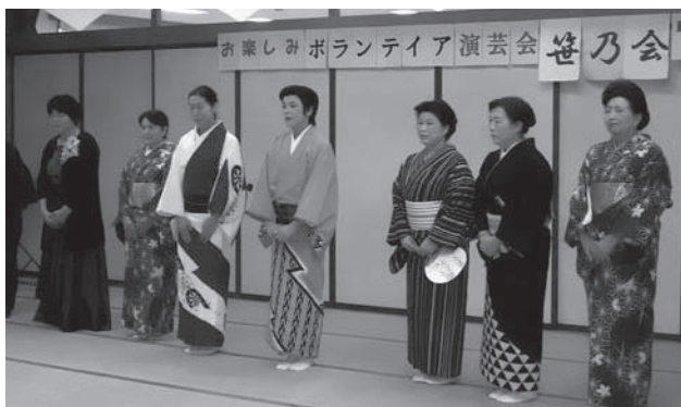
踊り・歌・マジックショーと楽しみました 笹乃会様