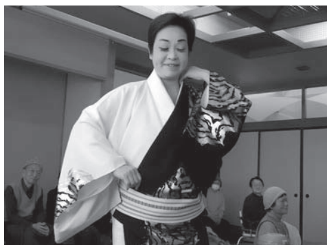
「桃太郎!」の掛け声も飛び会場を魅了した 英桃太郎と鈴英会様