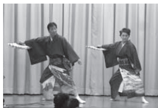
牧園流とりや教室様