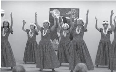
ハワイアンフラはくい様