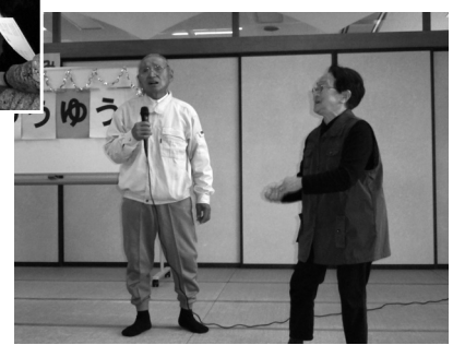
花より団子 お花見の会