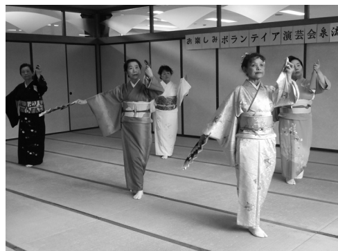
華麗な踊り 泉流日本舞踊様