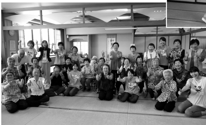
県立看護大学生さんと笑いヨガ イエーイエー

* 囲碁・将棋・卓球台を設置して、皆様のご来館をお待ちしています。 * 行事が決まりましたら、館内でお知らせします。