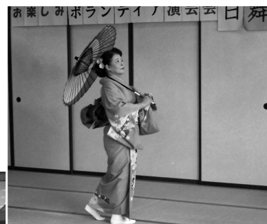
すてきな踊り 日舞三条流様