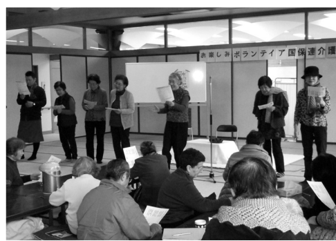
認知症予防劇上演 虹の会の皆様 熱演ありがとうございます