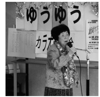
恒例のカラオケ大会 美声で賞♪