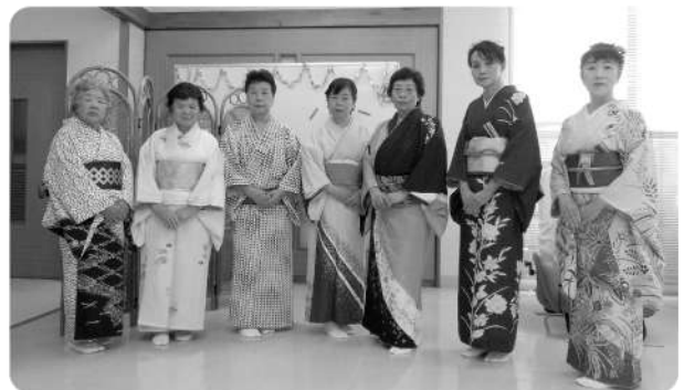
鹿島日舞会様 楽しいひとときをありがとうございました