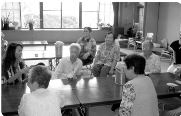
今年も東洋大学学生が中能登町の高齢者の 皆様の生きがいや健康増進 などのお話を 聞くため 来館しました