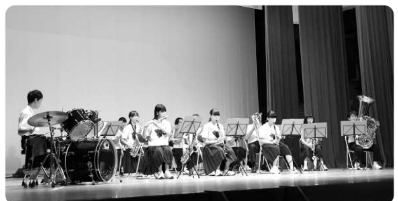
中能登中学校吹奏楽部