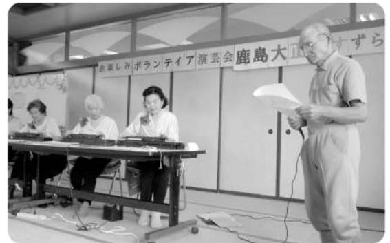
鹿島大正琴すずらん教室の皆様の演奏に合 わせてなつかしのメロディを合唱しました