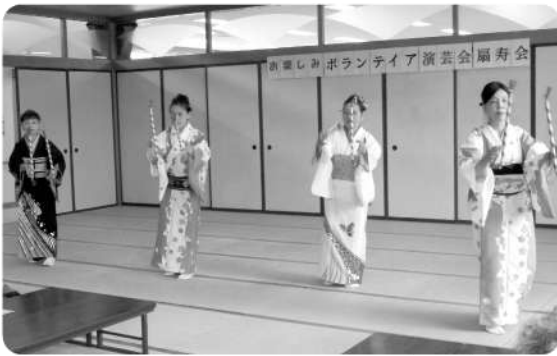
ドンパン節を踊っている扇寿会の皆様 ありがとうございました