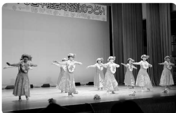
夢追い織姫シスターズ