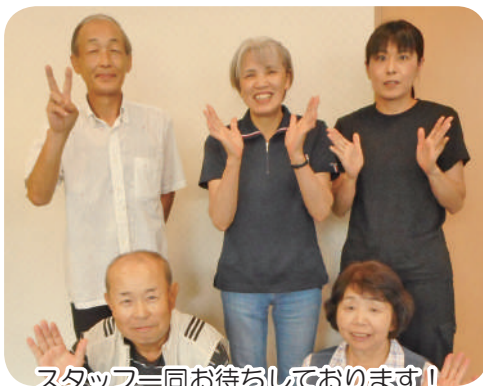
スタッフ一同お待ちしております！