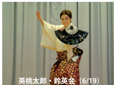
英桃太郎・鈴英会 (6/19)