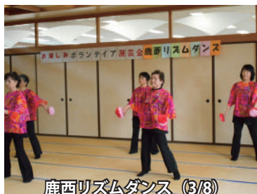
鹿西リズムダンス (3/8)