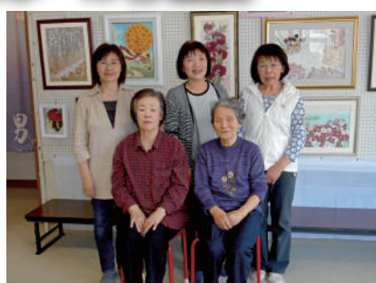
5月 花空間 sakura 押し花・プリザードフラワー展