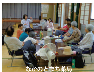
なかのとまち薬局