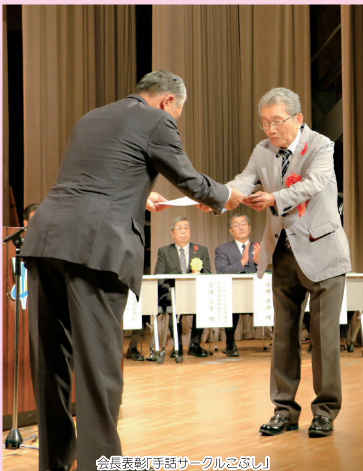
会長表彰「手話サークルこぶし」