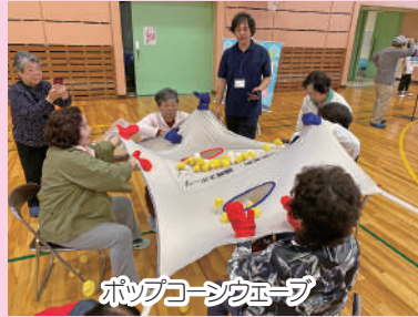
ボツコーンクエーブ

交流会には28名が参加され、ビンゴボードや卓球バレー、カローリングのほか、中能登町の繊維をモチーフにした、繊維スポーツなどで交流を深めました。