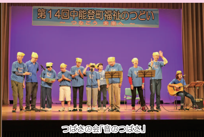
つばさの会「音のつばさ」