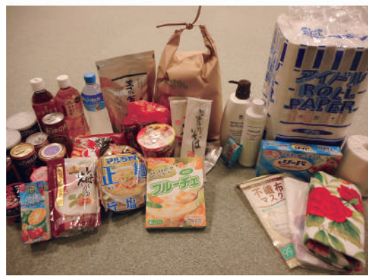
▲ 一世帯にお渡した品物