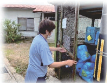
▲ 出勤前にちょっとゴミ出しご近所のゴミ出しをお手伝い ▶

『なかのと結び隊』とは、中能登町に住んでいる高齢者世帯などが抱えている「ゴミ出し」などのちょっとした困りごとを、少額料金で短時間のお手伝いを行う有償ボランティア事業です。